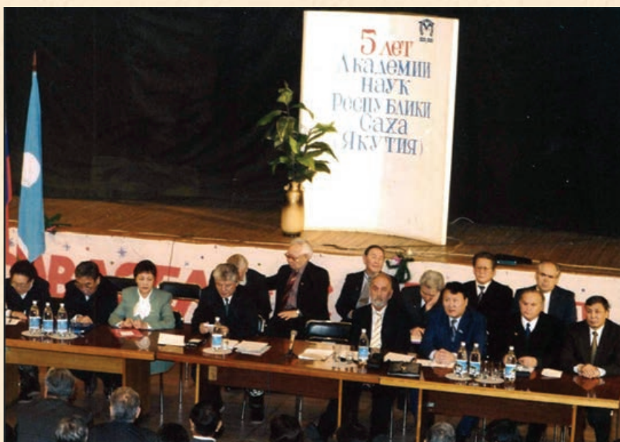
Президиум торжественного заседания, посвященного 5-летию Академии наук РС(Я) (1998 г.)

делениями академии за период с 1997 по 2006 г. был получен ряд результатов очень высокого уровня. Так, принято участие в написании 60-томного академического издания «Памятники фольклора народов Сибири и Дальнего Востока», которое в 2001 г. удостоено Государственной премии РФ в области науки и техники, начато составление и плановое издание многоязычного академического «Толкового словаря якутского языка», который не имеет аналогов в мире среди тюркских словарей подобного типа, подготовлены