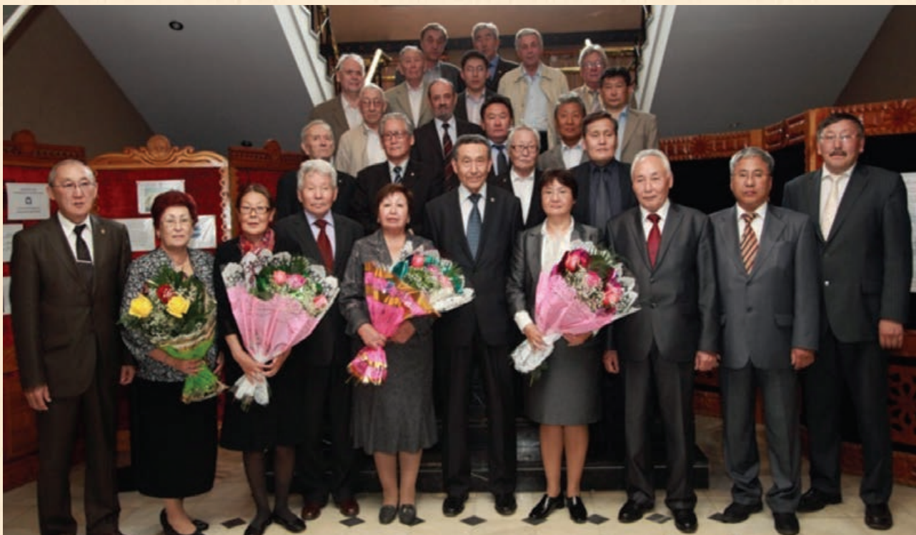
Действительные члены Академии наук РС(Я) с новым пополнением их численного состава (2012 г.)

В связи с утверждением новых направлений научной и научно-организационной деятельности Академии наук РС(Я) была существенно изменена ее структура. В 2011 г. в систему академии наук возвращен Институт социальных проблем труда, преобразованный в соответствующий центр исследований по данной проблеме, при Президиуме АН РС(Я) создан «Арктический научный центр». Современная структура академии включает следующие подразделения: