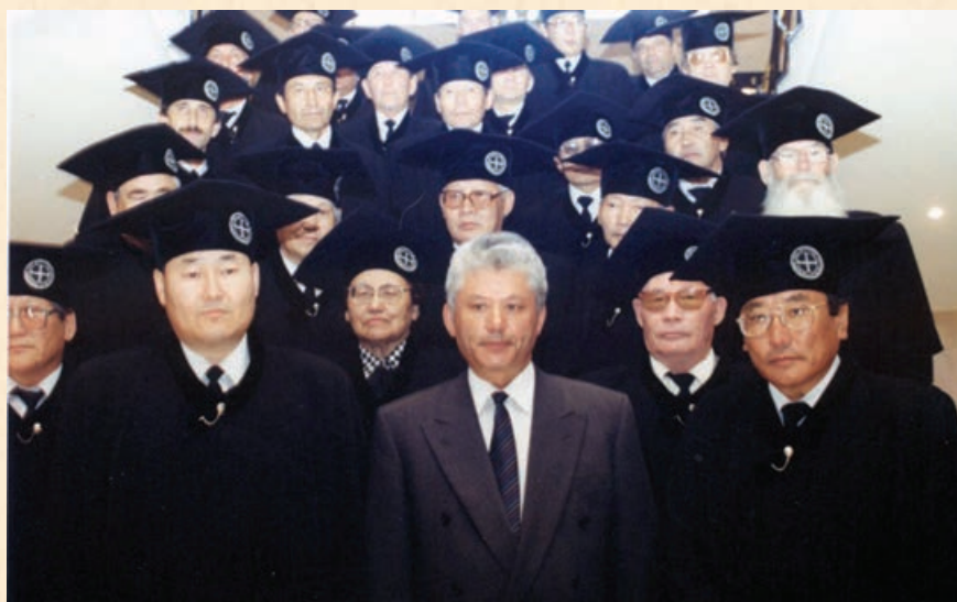
Первый состав действительных членов Академии наук РС(Я) с Президентом Республики Саха (Якутия) М. Е. Николаевым (1995 г.)

Для координации научных исследований, проводимых в республике,