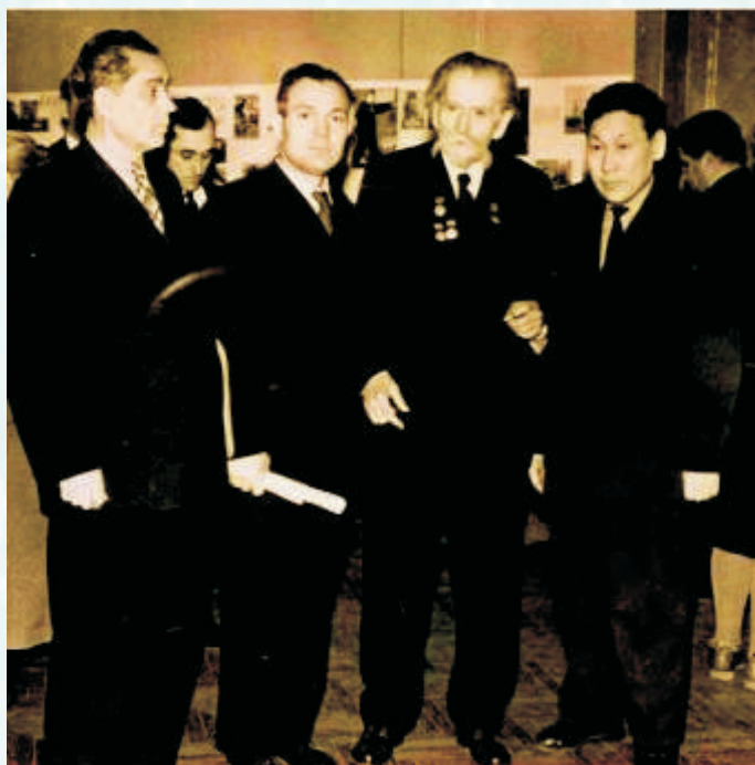
Рядом со своим учителем, академиком, Героем Социалистического Труда К.И. Скрябиным на Всесоюзной научной конференции по гельминтологии (Москва, 1950 г.).